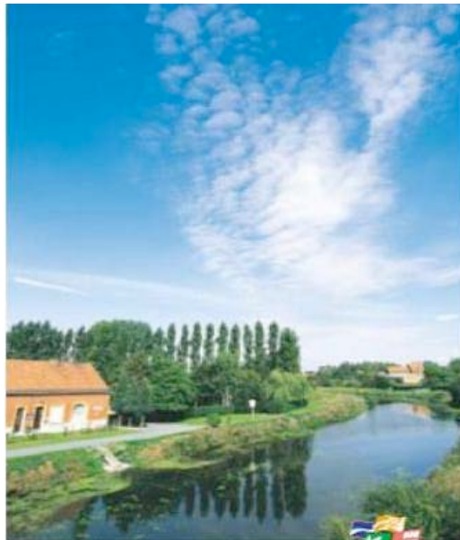
La Scarpe à Nivelles

Une carte postale de L'Office du Tourisme de La Porte Du Hainaut vous a été envoyée.